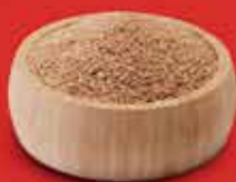
300 g de trigo para quibe