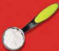
Sal a gosto