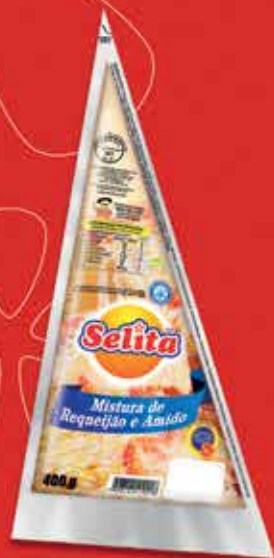
1 bisnaga de Requeijão Selita 150 g