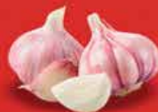
3 dentes de alho picado