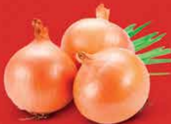
1 cebola picada