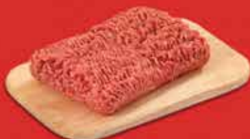
500 g de carne moída (de preferência moída 2x)