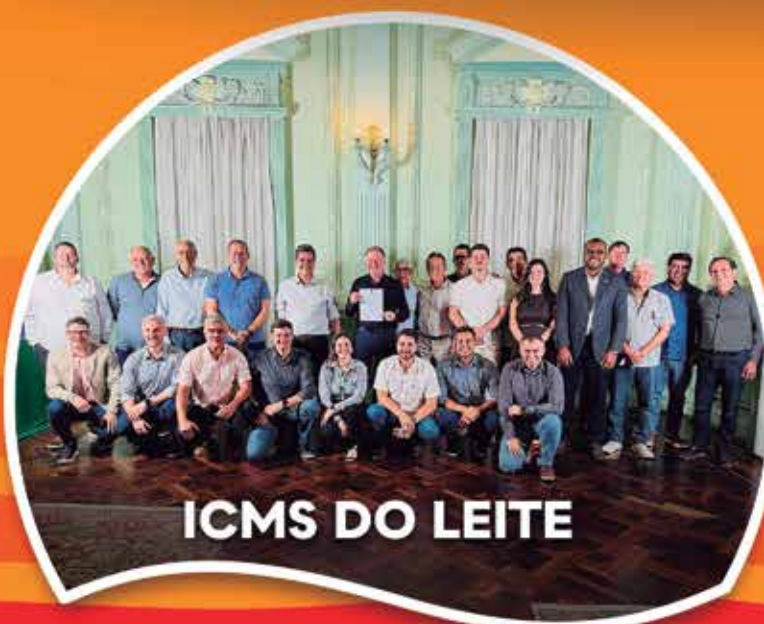
ICMS DO LEITE