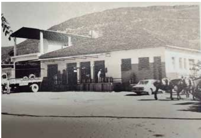
Posto de recepção de leite de Muniz Freire

Cada foto e cada lembrança reforçam a importância de preservar a história e valorizar os personagens que ajudaram a escrever essa referência no cooperativismo.