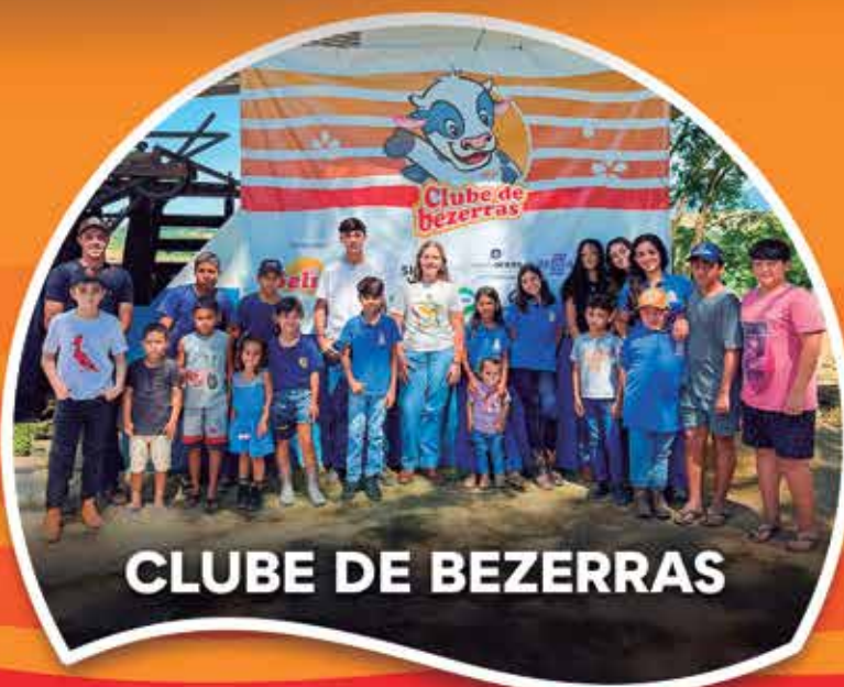
CLUBE DE BEZERRAS