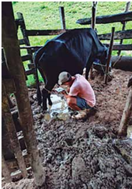
Robertson Valladão de Azeredo RVA Consultoria Ltda. Especializada na Implantação de Boas Práticas Agropecuárias

Nesta época do ano, é muito comum acontecer o acúmulo de poças d'água, fezes e lama no entorno e até dentro das instalações e isso não é bom! Essa lama, muito rica em matéria orgânica, normalmente, abriga uma quantidade